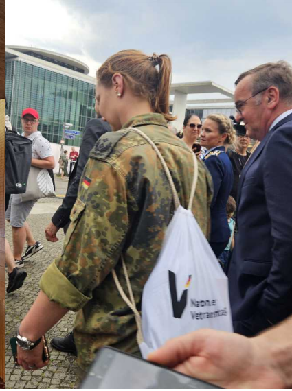
28 juin – Tag der Bundeswehr 2025 - Köln