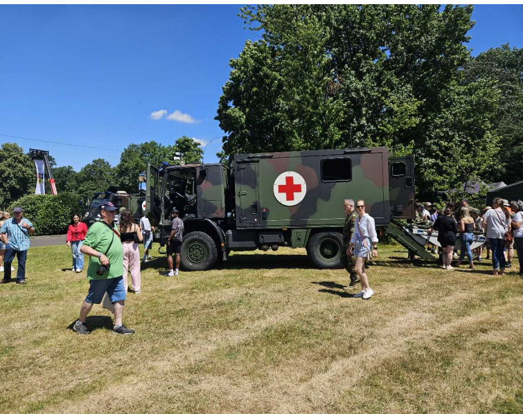
28 juin – Tag der Bundeswehr 2025 - Köln