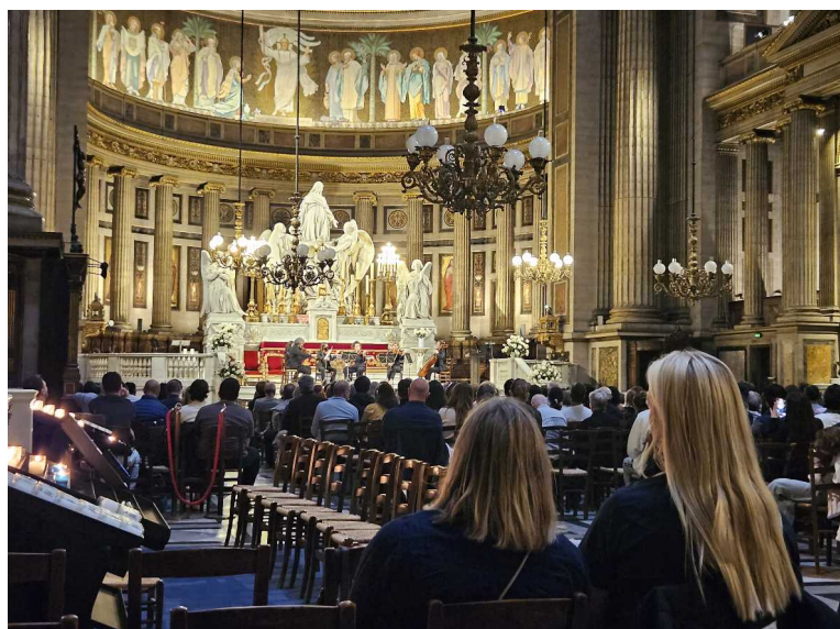
7 juin – Concert église de la Madeleine