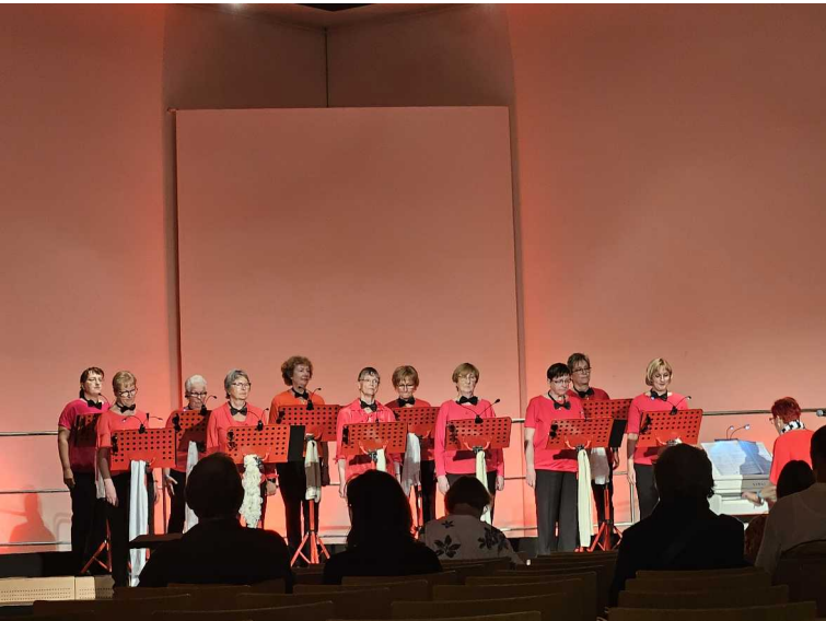
30 mai - Nüremberg