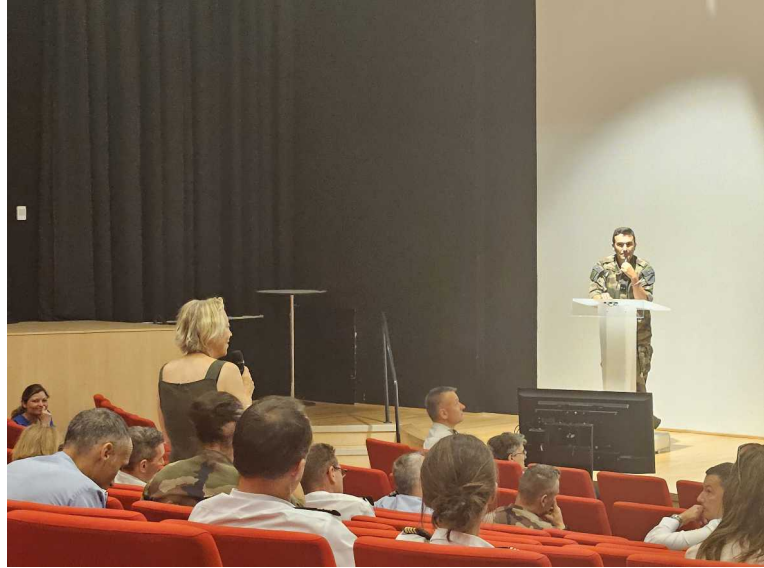
20 juin – Chance d'un second souffle - Balard