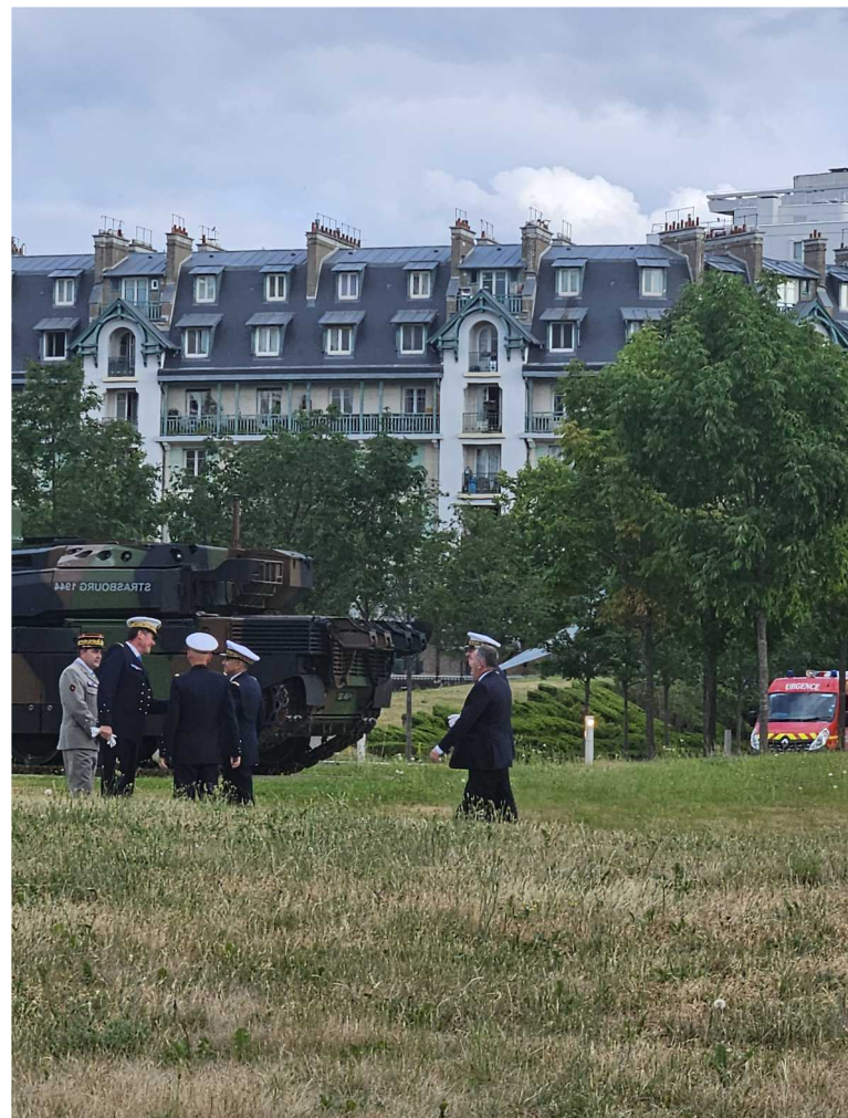
27 juin – Adieu aux armes du général de corps aérien Thierry Garreta