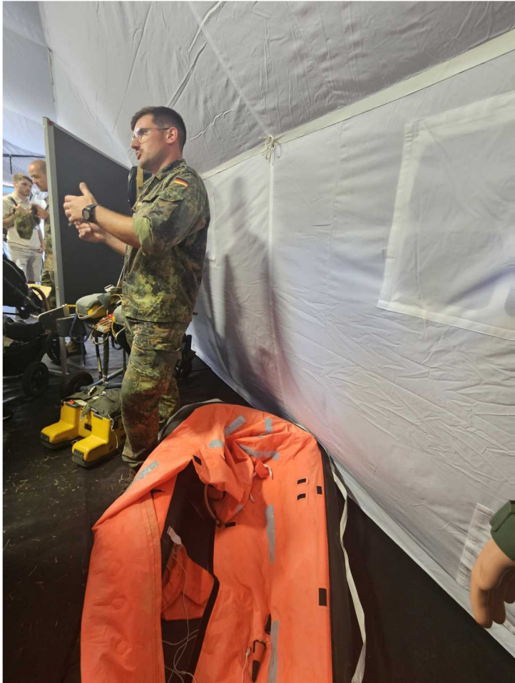
28 juin – Tag der Bundeswehr - Köln