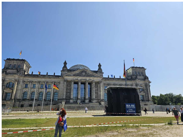
14 juin - Berlin