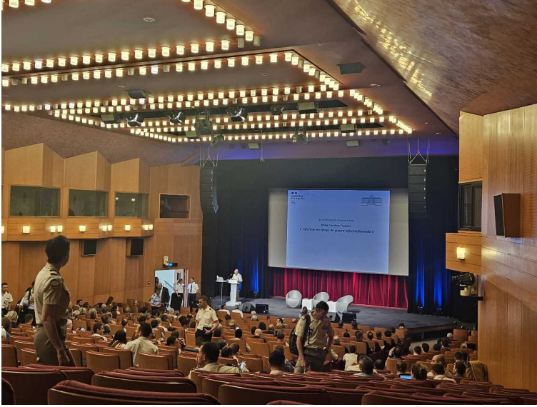
14 mai – conférence École de guerre – École Militaire