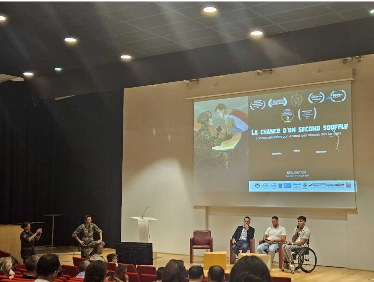
20 juin – Chance d'un second souffle - Balard