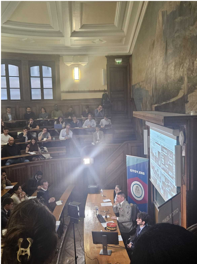
24 avril – Conférence CPCO – La Sorbonne