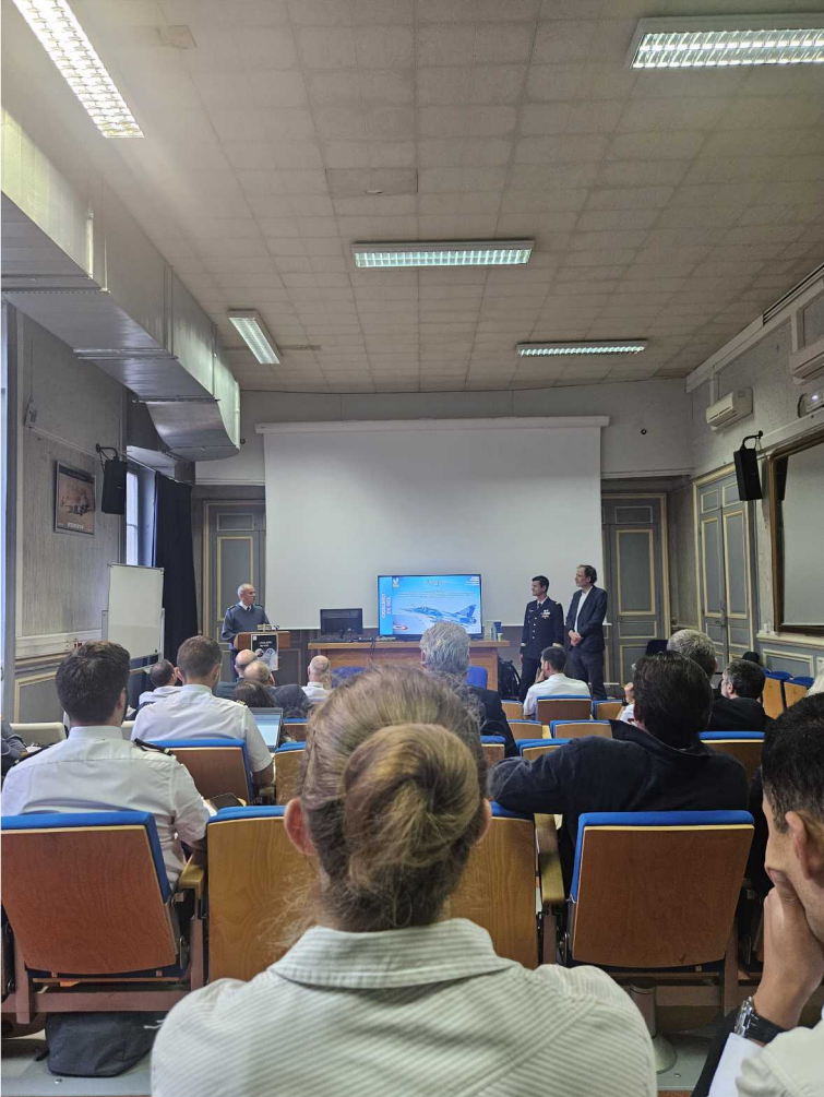
5 juin – Vol de Nuit – Ecole Militaire