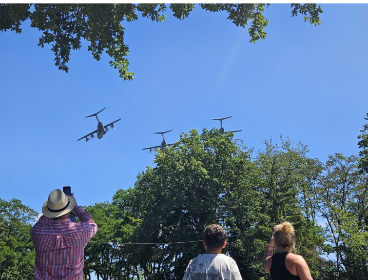
28 juin – Tag der Bundeswehr 2025 - Köln