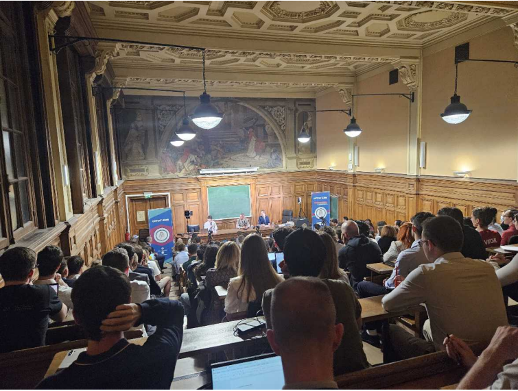
28 avril – conférence DRM – La Sorbonne

Il nous revient désormais de nous sentir tous concernés quant à la diffusion de la compréhension du lien franco-allemand qui nous unit.