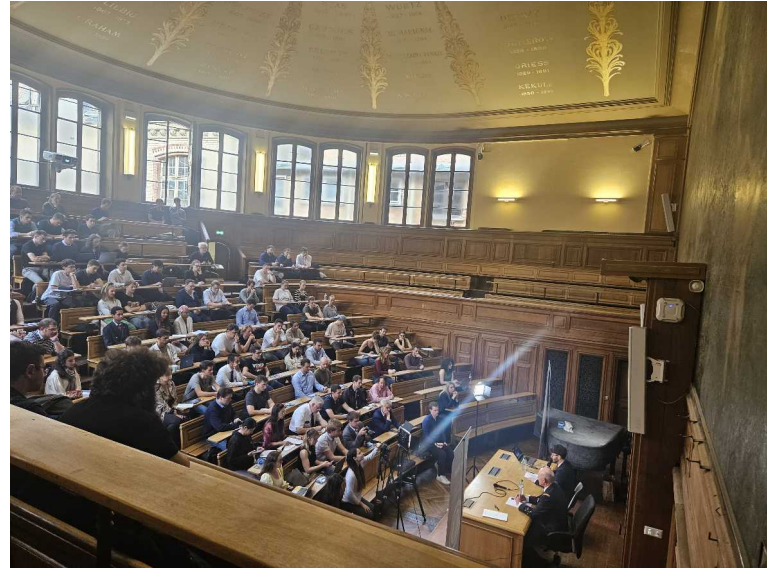
13 mai – conférence CEMAEE – La Sorbonne