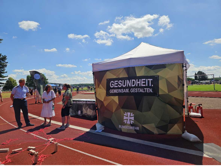
28 juin – Tag der Bundeswehr - Köln