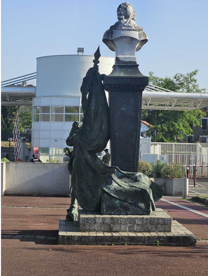
2 juillet - Percy