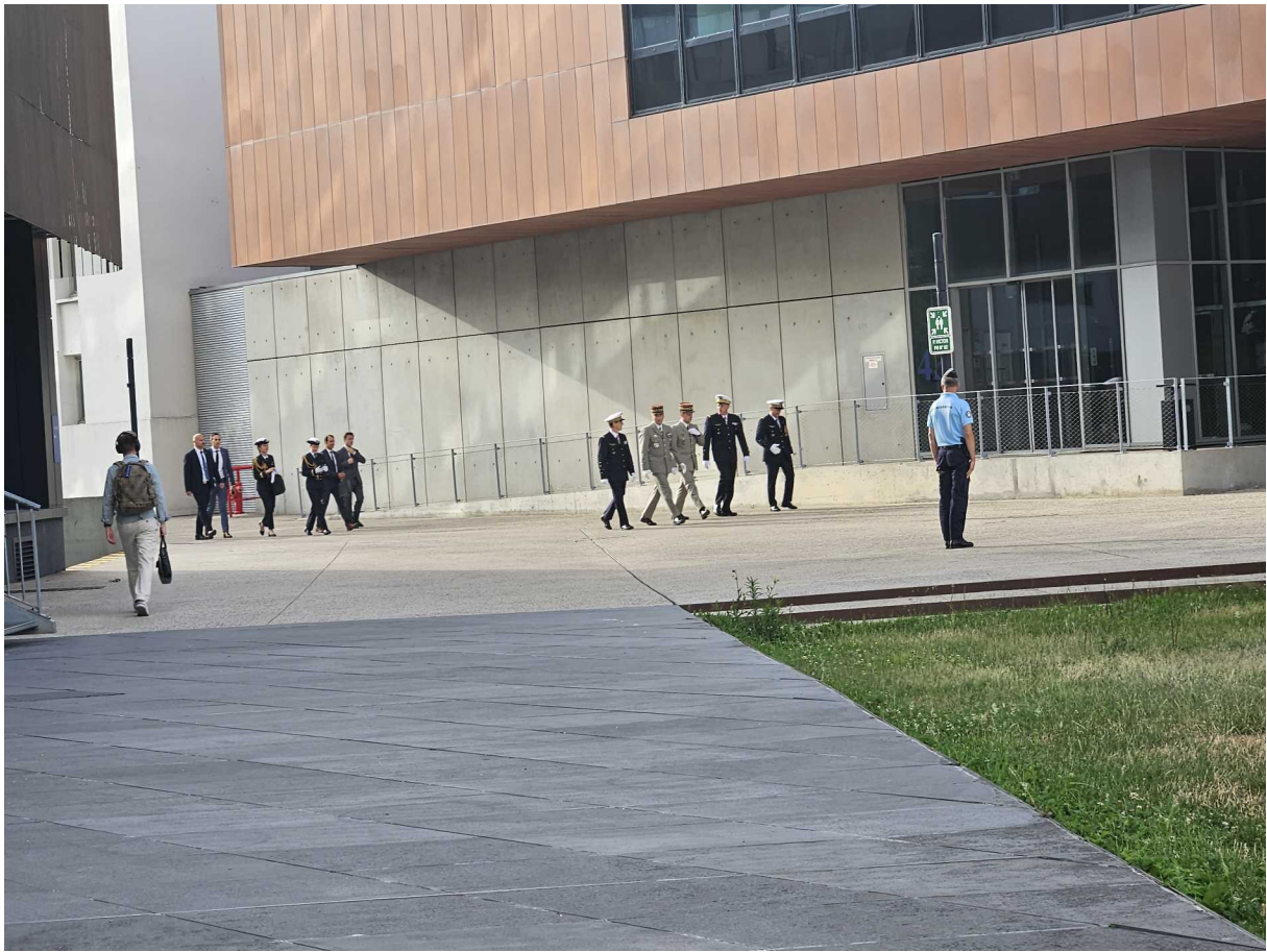
27 juin – Adieu aux armes du général de corps aérien Thierry Garreta