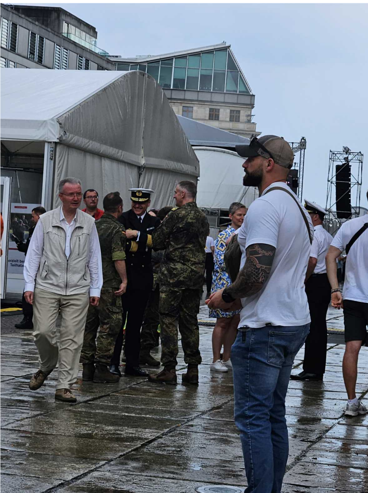
15 juin – Veteranen Tag 2025 - Berlin